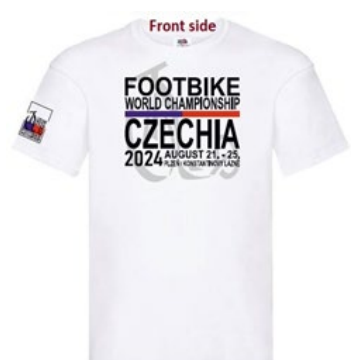
Přední strana trička